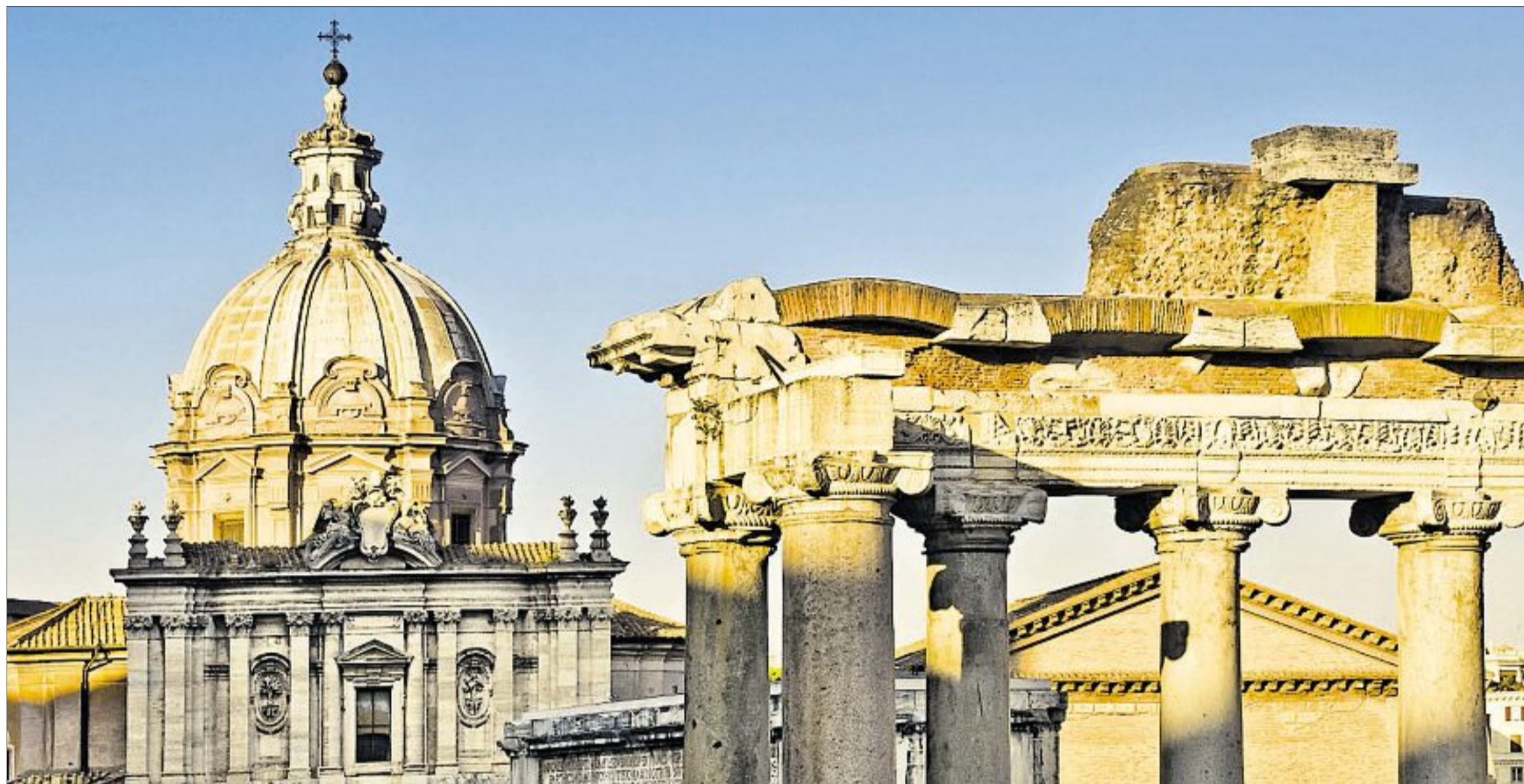
Das Forum Romanum: Zu Luthers Zeiten Steinbruch für die Aufträge des Baulöwen Papst Julius II.